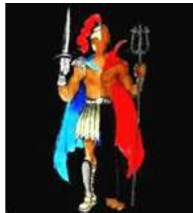
LENDA DE OGUM XOROQUÊ